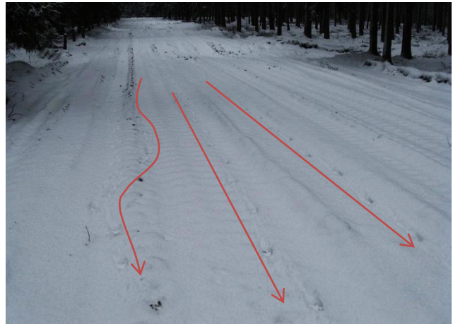
Abb. 2: Drei Wolfsfährten im Schnee bei Oerrel, 18.3.2013.

Dokumentation von drei parallel verlaufenden Fährten weist drei Tiere sicher nach (s. Abb. 2). Es wurden im Rahmen des Projektes auch vermehrt Losungen in der Region Oerrel und Wriedel gefunden, von denen sich ein Großteil noch in der Analyse befindet. Ob sich noch alle drei Welpen aus dem letzten Jahr im Territorium der Elterntiere aufhalten, ist allerdings nicht eindeutig geklärt.