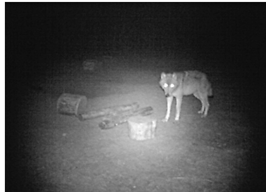
Abb. 5: Wolfnachweis auf dem Schießplatz Meppen am 31.3.2013.

Am 31.3.2013 wurde schließlich mittels einer Fotofalle des Bundesforstbetriebes Niedersachsen auf dem Gelände des Schießplatzes Meppen ein Wolf im Landkreis Emsland nachgewiesen. Somit konnte der erste Einzelnachweis eines Wolfes im westlichen Niedersachsen erbracht werden. Bislang kann nicht sicher gesagt werden, ob das Tier sich dort schon längerfristig aufhält bzw. aufhalten wird oder ob es sich um einen durchziehenden Wolf handelt. Im Nachhinein gemeldete Sichtungen sowie einzelne Trittsiegel aus dem Januar 2013 können aber Hinweise sein, dass sich das Tier dort schon länger aufhält.