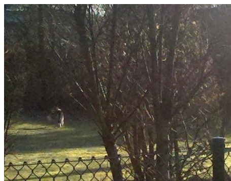
Abb. 3: Foto aus dem Landkreis Oldenburg, 27.3.2013.

Nachdem im Jahr 2012 lediglich eine Sichtung (C3) aus dem Osnabrücker Raum gemeldet worden war, wurden im ersten Quartal 2013 mehrere Meldungen aus dem westlichen Niedersachsen bekannt. Im Januar wurden aus dem Landkreis Oldenburg zwei Sichtungen sowie eine Fährte gemeldet. Im März wurde zudem ein Foto aus der Region eingesendet. Darauf ist ein Canide von hinten abgelichtet, so dass eine Unterscheidung