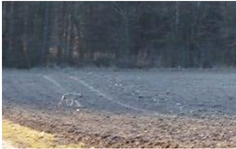
Abb. 4: Canide im Landkreis Osnabrück, 26.3.2013.

Des Weiteren wurden einzelne Sichtungen aus den Landkreisen Diepholz, Osnabrück und Vechta gemeldet. In der Nähe von Merzen im Landkreis Osnabrück entstand zudem im März ein Foto, welches einen Caniden zeigt. Dieses Foto lässt einen Wolf zwar schon stark vermuten, für einen sicheren Nachweis reicht die Qualität allerdings nicht aus.